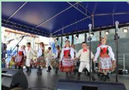
12.06.2016. Festyn zespołów ROK w parafii w. Krzyża w Łomży