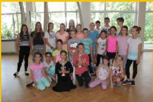
16-21.08.16. Warsztaty Zespołu Pie ni i Ta ca „Łom a”.