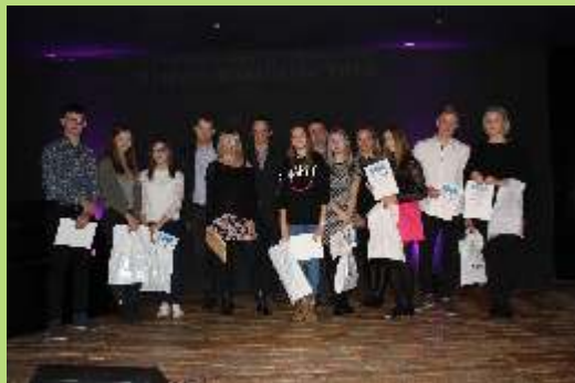
25-26.11.2016. XXIV Scena Młodych Wokalistów Giełda Piosenki Dzieci cej im. M. emka.