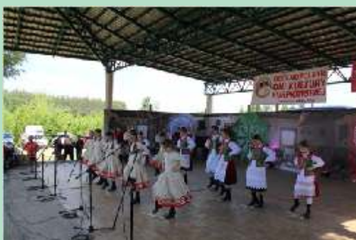
19.06.2016. XXIII Ogólnopolskie Dni Kultury Kurpiowskiej w Nowogrodzie.