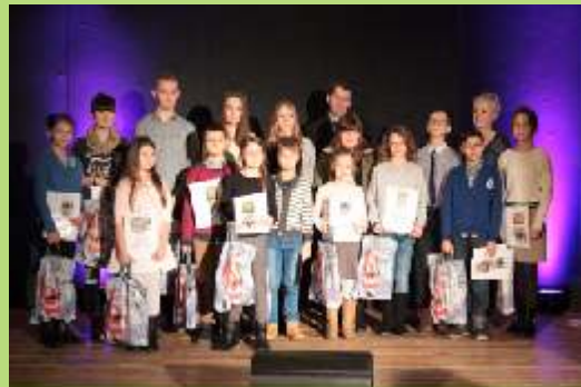
10.12.2016. Finał konkursu plastycznego Łom yskie Tradycje Bo onarodzeniowe.