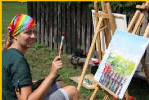
1-7.08.2016. Ogólnopolski plener malarski w Szostakach „Kultura łom y ska p dzlem malowana.