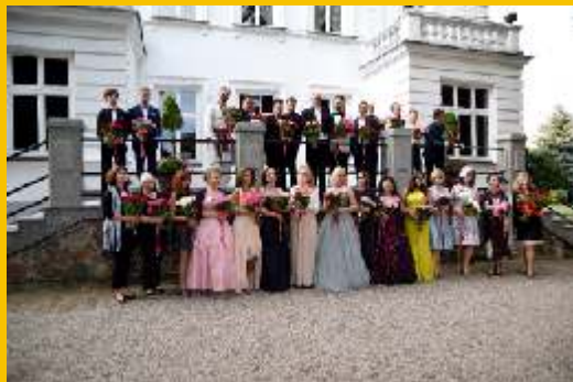
01-10.07.2016. XXIII Festiwal Muzyczne Dni Drozdowo-Łom a 2016.