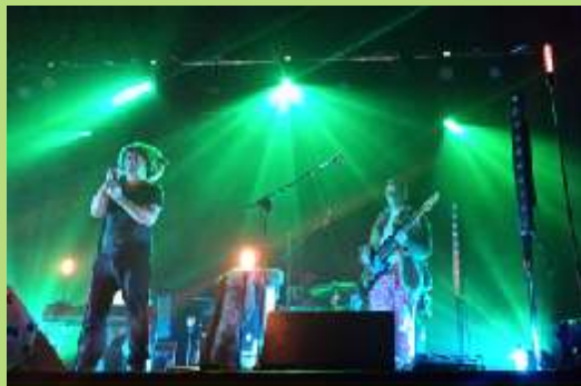
03.12.2016. Koncert zespołu Czesław piewa.