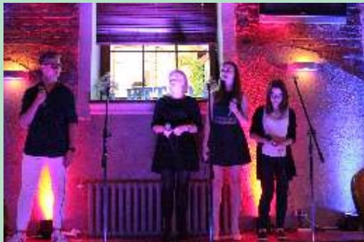
03.06.2016. Koncert wokalistów Studia Wokalnego ROK w restauracji Retro.