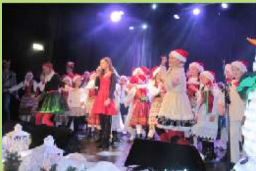
05.12.2016. Mikołajki z ROKiem.