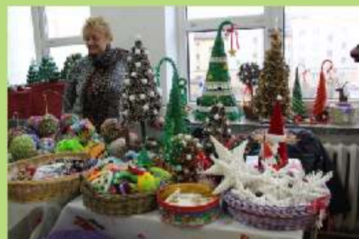
10.12.2016. Mikołajkowe Targi Twórczo ci Artystycznej