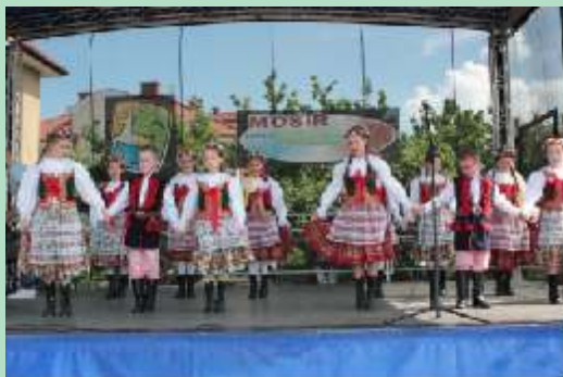
29.05.2016. Występ zespołu Pieśni i Tańca „Łomża” na Festynie w parafii p.w. w. Andrzeja Boboli.