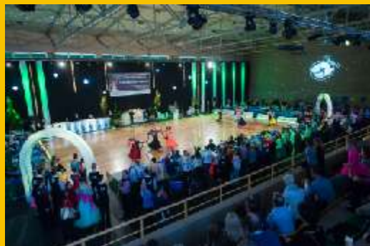
23.10.2016. XX Ogólnopolski Turniej Ta ca Towarzyskiego o „Puchar Marszałka Województwa Podlaskiego, Starosty Łom yskiego i Prezydenta Miasta Łom a”.