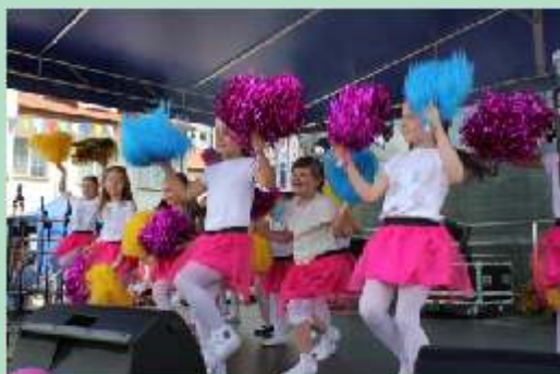
12.06.2016. Festyn zespołów ROK w parafii w. Krzyża w Łomży