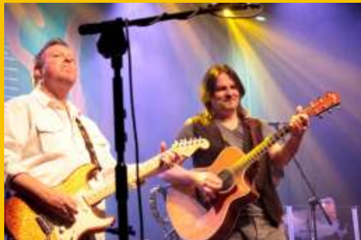
08.10.2016. Koncert Raya Wilsona.