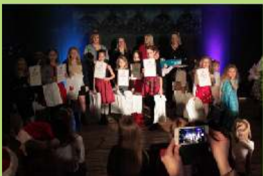
10.12.2016. Festiwal Piosenki wi tecznej „Gwiazdkowe Nutki”.