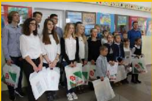
27.10.2016. Wr czenie nagród i wystawa pokonkursowa „Nie uzale nieniom”.